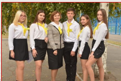
Команда ХГ № 46 ім. М.В. Ломоносова Слобідського району «Золотий запас»