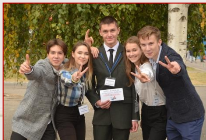
Збірна команда Київського району «555-й Меганполіс»