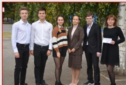
Команда ХСІІІ № 162 Новобаварського району «Elektrum»