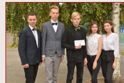
Команда ХЗОІІ № 126 Холодногірського району «Креативні економісти»