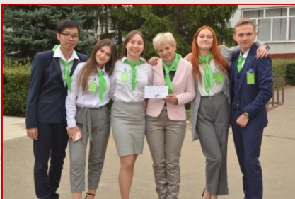
Збірна команда Московського району «Бізнес - сила»