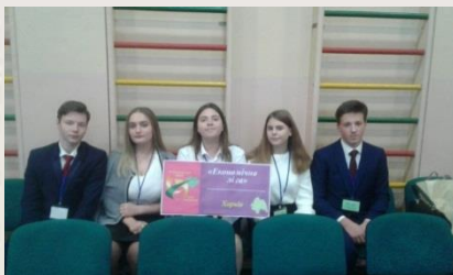
Команда ХГ № 163 «Економічна ліга» Індустріального району