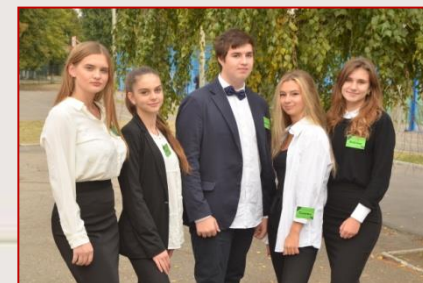
Збірна команда Шевченківського району «Ортіма»