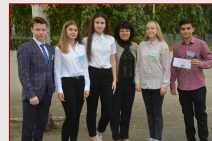
Збірна команда Індустріального району «Di vita»